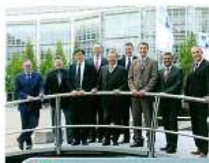
BRV Neuer Geist