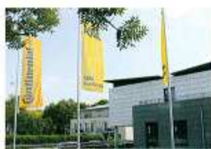
Conti Truckservice Erfolgreiche Kooperation