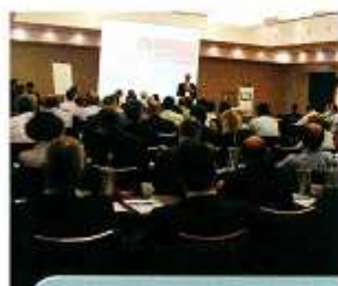
Aftersales-Forum Ungenutzte Potenziale